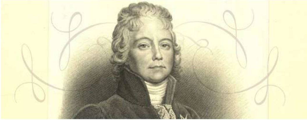
1814 – Император Наполеон I Бонапарт безоговорочно отрёкся от престола